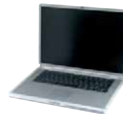
ORDINATEURS PORTABLES / ÉCRANS