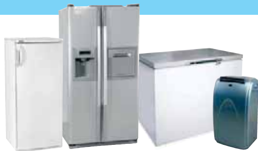
RÉFRIGÉRATEURS / CONGÉLATEURS / CLIMATISEURS