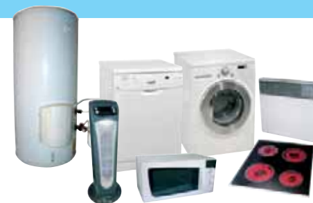
LAVAGE / CUISSON / CHAUFFAGE