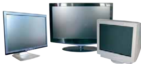
TÉLÉVISEURS / MONITEURS