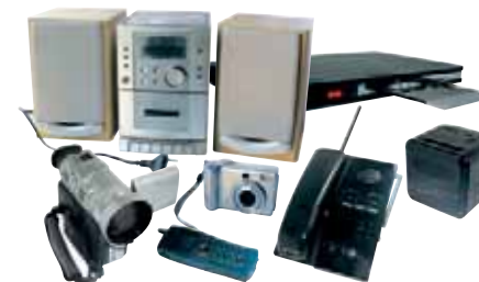
AUDIO / VIDÉO / TÉLÉPHONIE