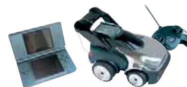
JOUETS / LOISIRS